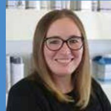
Jessica Coordination Education