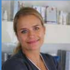
Vera Education Manager